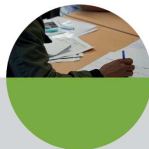
Airparif Services Formations professionnelles

Un focus est effectué sur les principales sources de pollution du territoire et sur les moyens d'améliorer la qualité de l'air et de réduire l'exposition des populations aux principaux polluants atmosphériques.